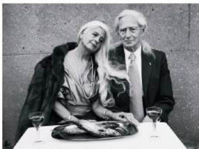
Portret van mijn moeder en vader, 1987